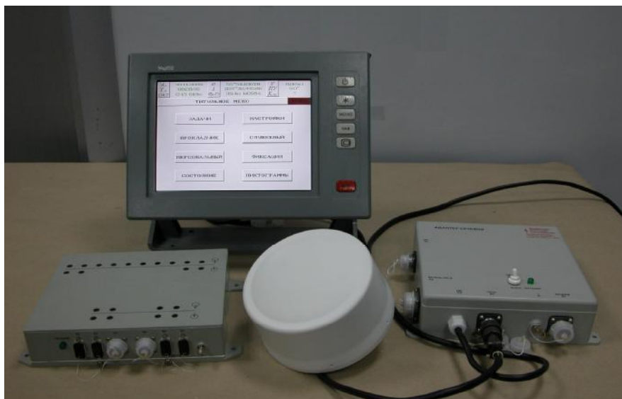
Рисунок 1 – Внешний вид аппаратуры