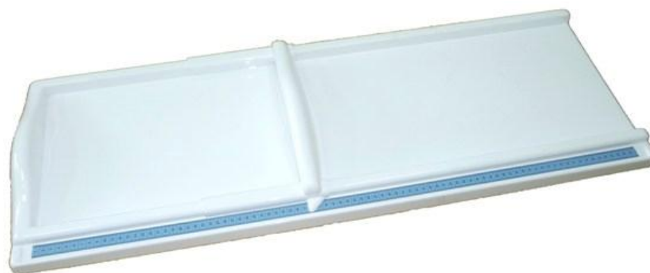
Рисунок 1 - Ростомер детский медицинский РДМ-01

Общий вид ростомера детского медицинского РДМ-01 представлен на Рисунке 1.