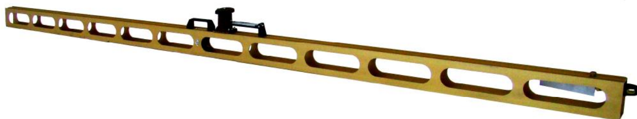
Рисунок 1 – Общий вид реек дорожных универсальных РДУ-КОНДОР

Рейки РДУ-КОНДОР, РДУ-КОНДОР-Э представляют собой трехсекционную складную конструкцию. В рабочем состоянии секции реек жестко скрепляются между собой. Рейки РДУ-КОНДОР-Н, РДУ-КОНДОР-Э-Н имеют неразрезную конструкцию. Все рейки изготовлены из анодированного алюминиевого сплава. На корпус рейки нанесена трехметровая метрическая шкала с ценой деления 5 мм. Рейка имеет пять контрольных меток, указывающих места измерений просветов под рейкой. Шаг меток (500±2) мм, расстояние от крайних меток до торцов рейки (500±2) мм. К рейке приложен клиновый промерник, на который нанесены две шкалы. На центральной части рейки дорожной РДУ-КОНДОР и РДУ-КОНДОР-Н смонтирован измеритель уклонов, состоящий из измерительной головки с лимбом, сочлененной с уровнем установки рейки в горизонтальное положение. На вращающийся лимб нанесена шкала для измерения уклонов в промилле. На центральной части рейки дорожной РДУ-КОНДОР-Э и РДУ-КОНДОР-Э-Н находится крепление для установки съемного электронного уровня. Во внутреннюю полость центральной части вмонтирован эклиметр, который представляет собой свободно вращающийся диск с противовесом. На диск нанесена симметричная шкала для измерения крутизны откосов. Сверху шкала эклиметра закрыта стеклом с нанесенным на него штрихом, по которому проводится измерение. Общий вид реек приведен на рисунках 1-4.