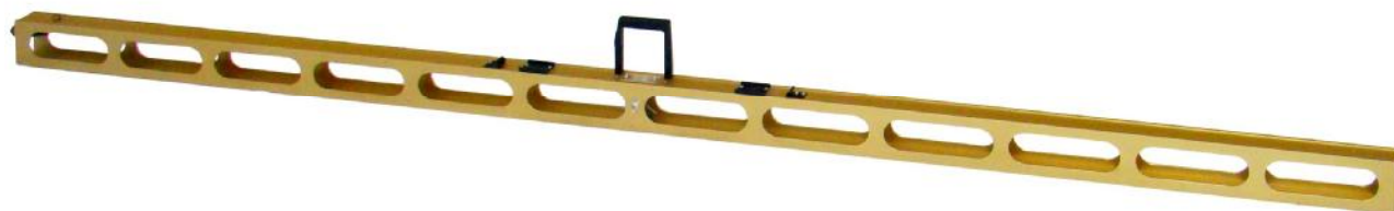
Рисунок 4 – Общий вид реек дорожных универсальных РДУ-КОНДОР-Э-Н

Общий вид клинового промерника приведен на рис. 5.