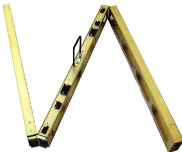
Рисунок 3 – Общий вид реек дорожных универсальных РДУ-КОНДОР-Э