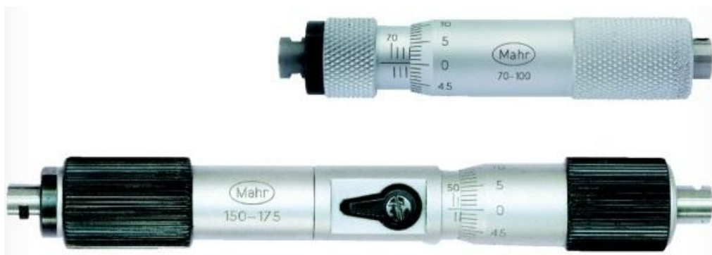
Рисунок 1 - Общий вид нутромеров микрометрических Micromar 44 F с диапазонами измерений 70-100 и 150-175.

Нутромеры Micromar 44 F, Micromar 44 CB поставляются отдельными приборами, нутромеры Micromar 44 Cms поставляются в наборе с удлинителями 44 Cv.