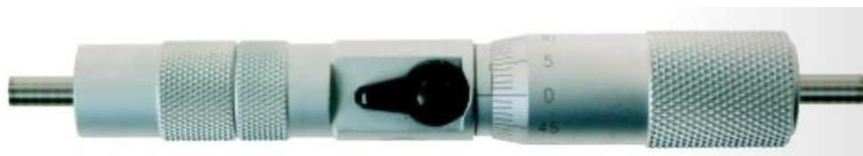
Рисунок 3 - Общий вид нутромеров микрометрических Micromar 44 СВ.