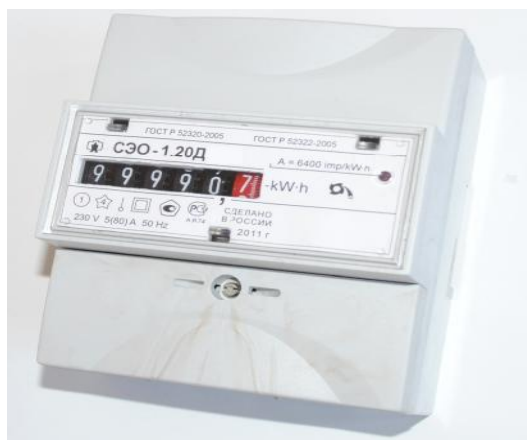
Рисунок 1 – Внешний вид счетчика СЭО-1.20Д

6 Внешний вид и схема пломбирования Внешний вид счетчиков СЭО-1.20Д с закрытой клеммной крышкой и схема опломбирования приведены на рисунках 1, 2.