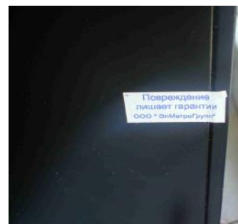
Рисунок 2 – Схема и внешний вид пломбировки регистратора от несанкционированного доступа.