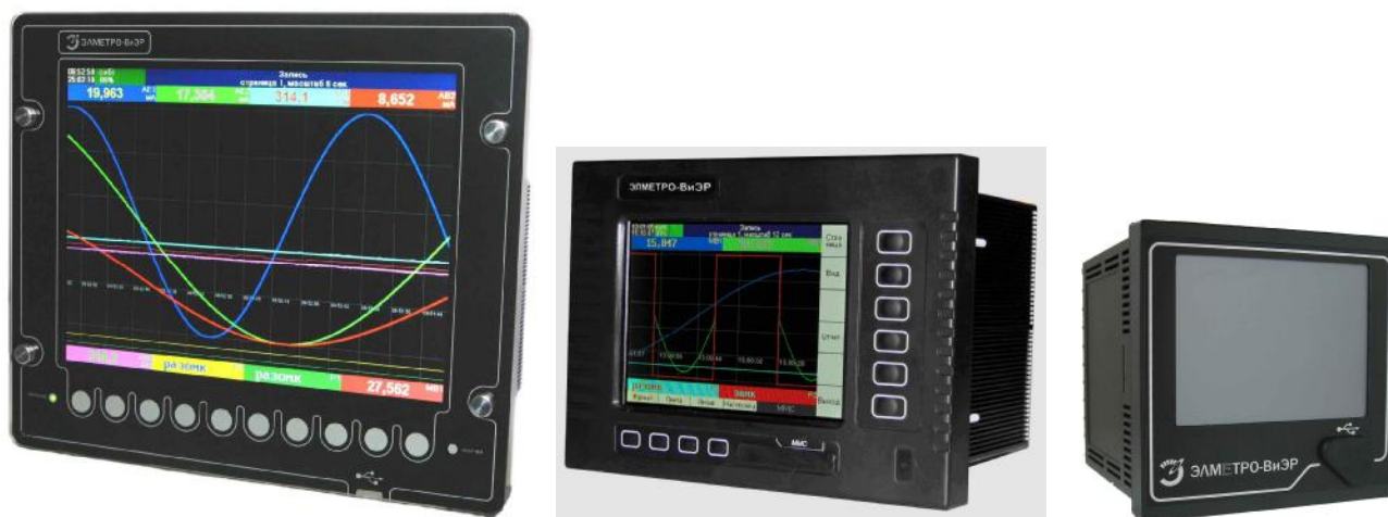
Рисунок 1 – Фотографии общего вида регистраторов

Фотографии общего вида регистраторов представлены на рисунке 1.