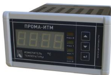
Фото 1. Фотография общего вида измерителя щитового исполнения ПРОМА-ИТМ-Щ.

Фотографии общего вида измерителей приведены на фото 1,2,3,4.