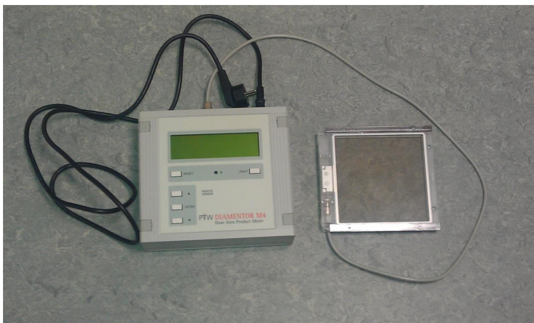
Рисунок 1 – Дозиметр рентгеновского излучения DIAMENTOR M4.

Внешний вид дозиметра представлен на рисунке 1.