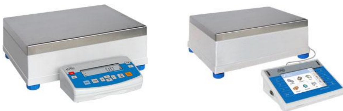
Рисунок 3 – Общий вид весов с графическим дисплеем и с сенсорным дисплеем.