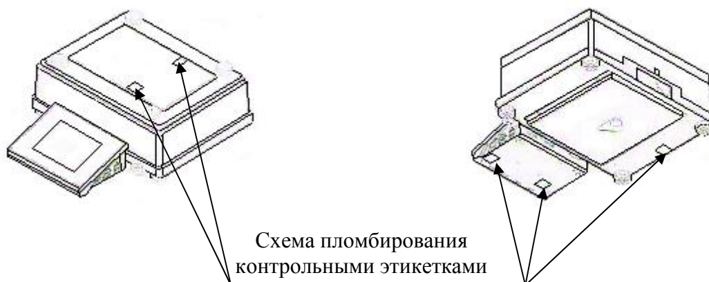
Рисунок 2 - Схема пломбирования от несанкционированного доступа весов АРРxxx/Y