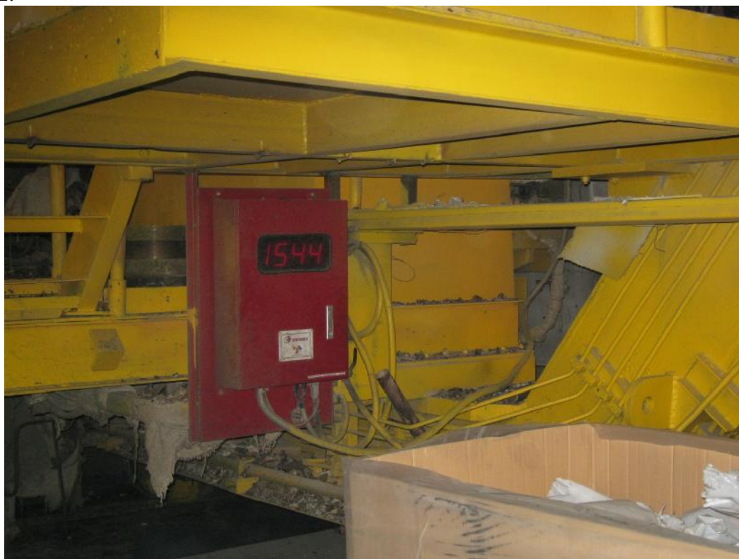
Рис. 2 - Процессор системы OPTICAST

Фотография процессора системы OPTICAST в условиях эксплуатации представлена на рисунке 2.