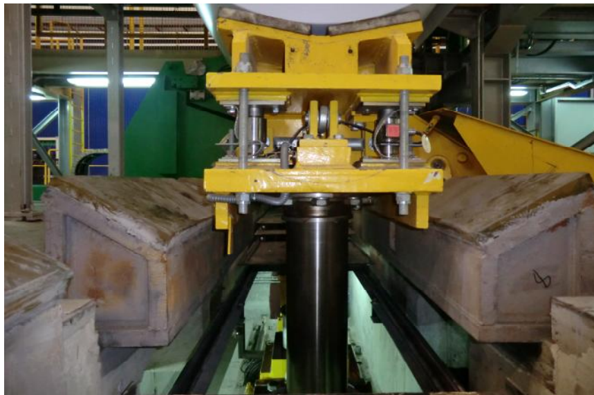
Рисунок 1 - Общий вид весов для взвешивания рулонов металла ВТР-25.

Принцип действия весов основан на преобразовании деформации упругого элемента весоизмерительного тензорезисторного датчика (далее-датчик), возникающей под действием силы тяжести взвешиваемого груза, в аналоговый электрический сигнал, изменяющийся пропорционально массе груза. Результаты взвешивания выводятся на дисплей весоизмерительного прибора. Измерение массы осуществляется после получения сигнала от позиционного датчика, в момент когда ГПУ располагается на измерительном участке рельсов.