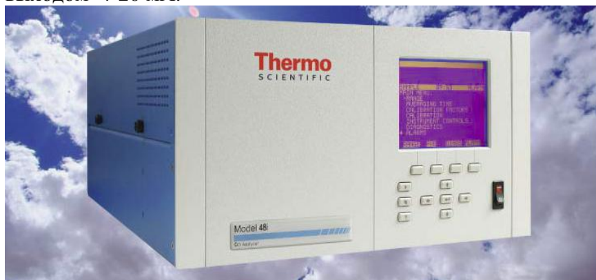
Фотография общего вида газоанализаторов модели 48i

Вывод данных может осуществляться непосредственно на ЖК экран, находящийся на передней панели газоанализатора, также прибор оснащен интерфейсами RS-232 и RS-485, для подключения к персональному компьютеру или печатающему устройству и аналоговым выходом 4-20 мА.