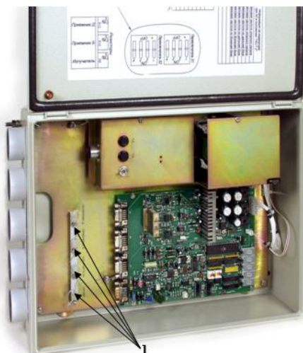
Рисунок 2. Схема пломбирования измерителей ИМДВ-01. Пломбы на блоке электроники – 1.