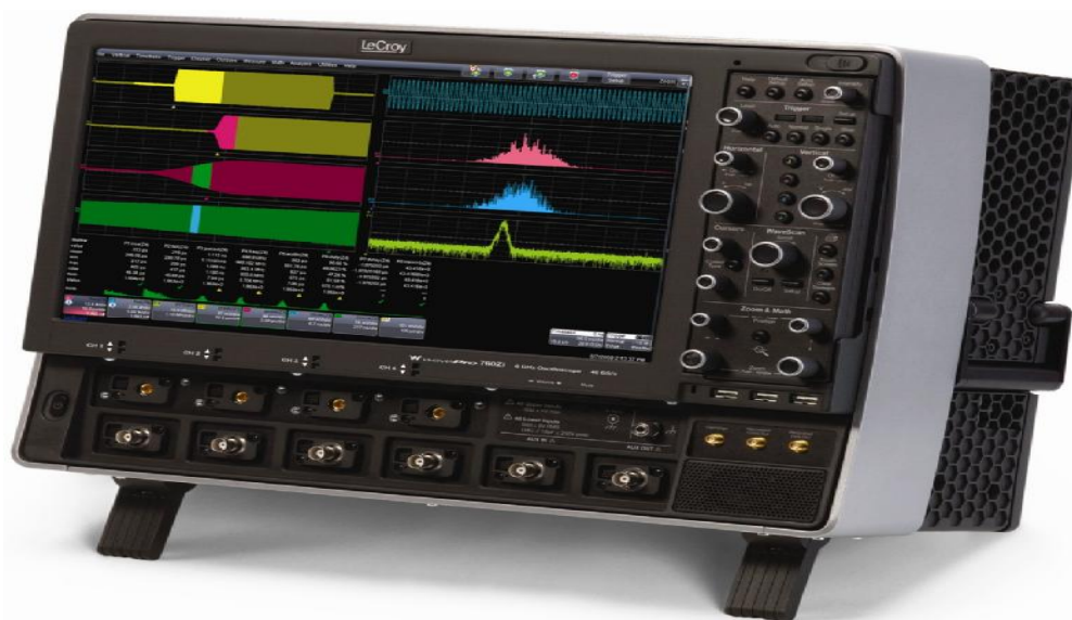
Рисунок 1 - Внешний вид осциллографов

Схемы для размещения наклеек и пломбировки от несанкционированного доступа приведены на рисунке 3.