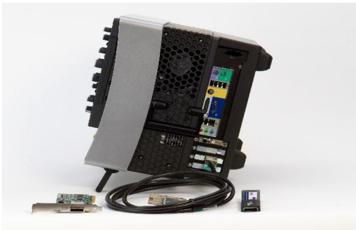
Рисунок 2 - Вид боковой панели осциллографов