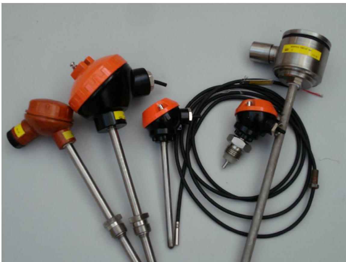
Рисунок 1 –Внешний вид

Фотография общего вида термопреобразователей сопротивления