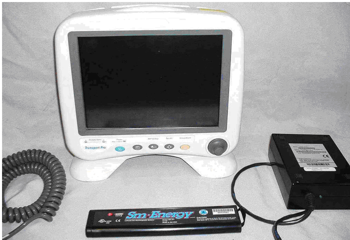
Рисунок 1. Внешний вид монитора пациента транспортного Transport Pro.