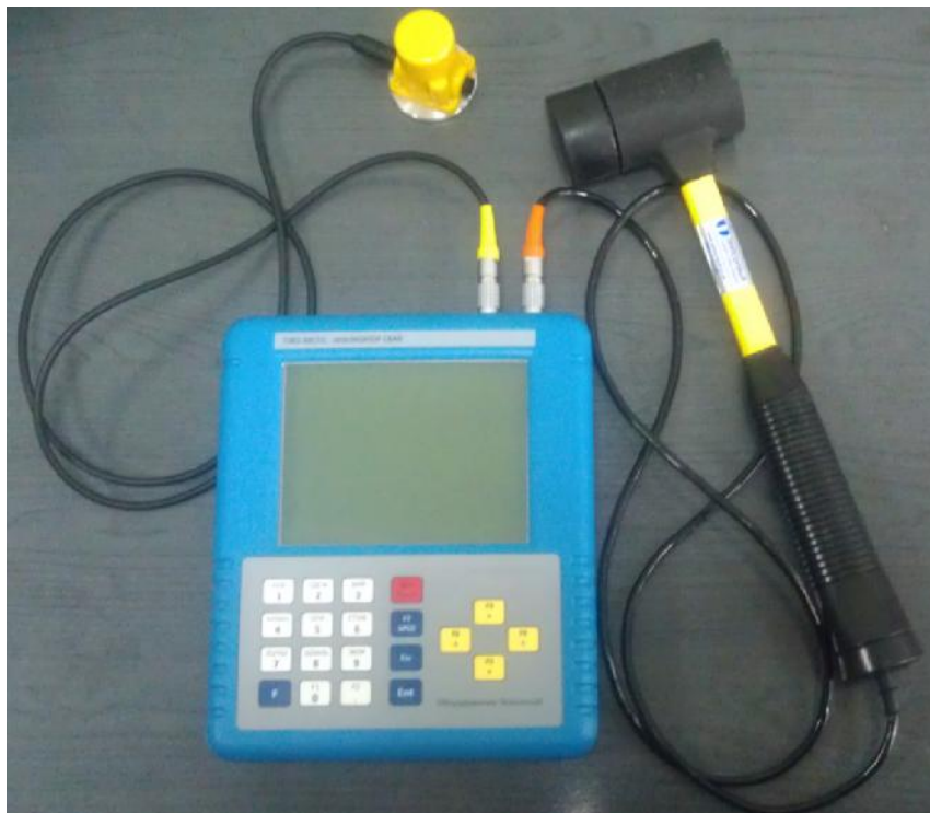
Рисунок 1 – Общий вид прибора TDR2

Результаты контроля сохраняются на электронном блоке и впоследствии могут быть переданы на компьютер. После установки на компьютере скорости распространения ультразвуковых колебаний выполняется расчет длины сваи и расстояния до дефектов.