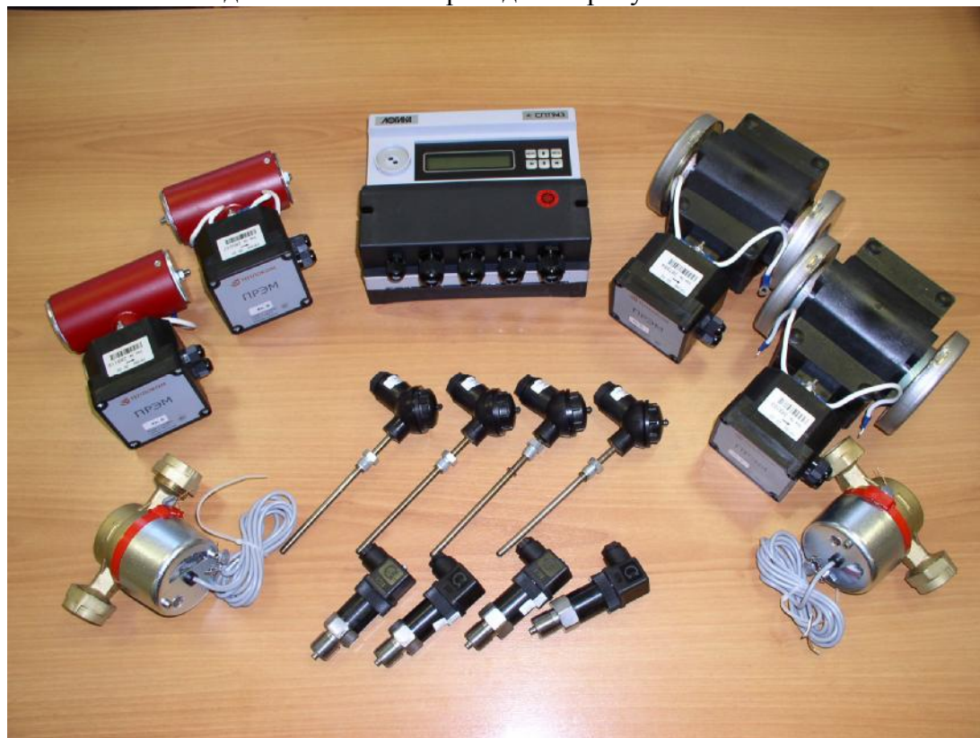
Рисунок 1 – Внешний вид теплосчетчика

Внешний вид теплосчетчика приведен на рисунке 1.