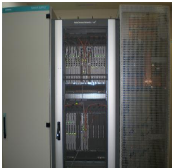
Рисунок 1- Общий вид оборудования с открытой дверью

Общий вид оборудования и схема пломбировки от несанкционированного доступа, представлены на рисунках 1 и 2.