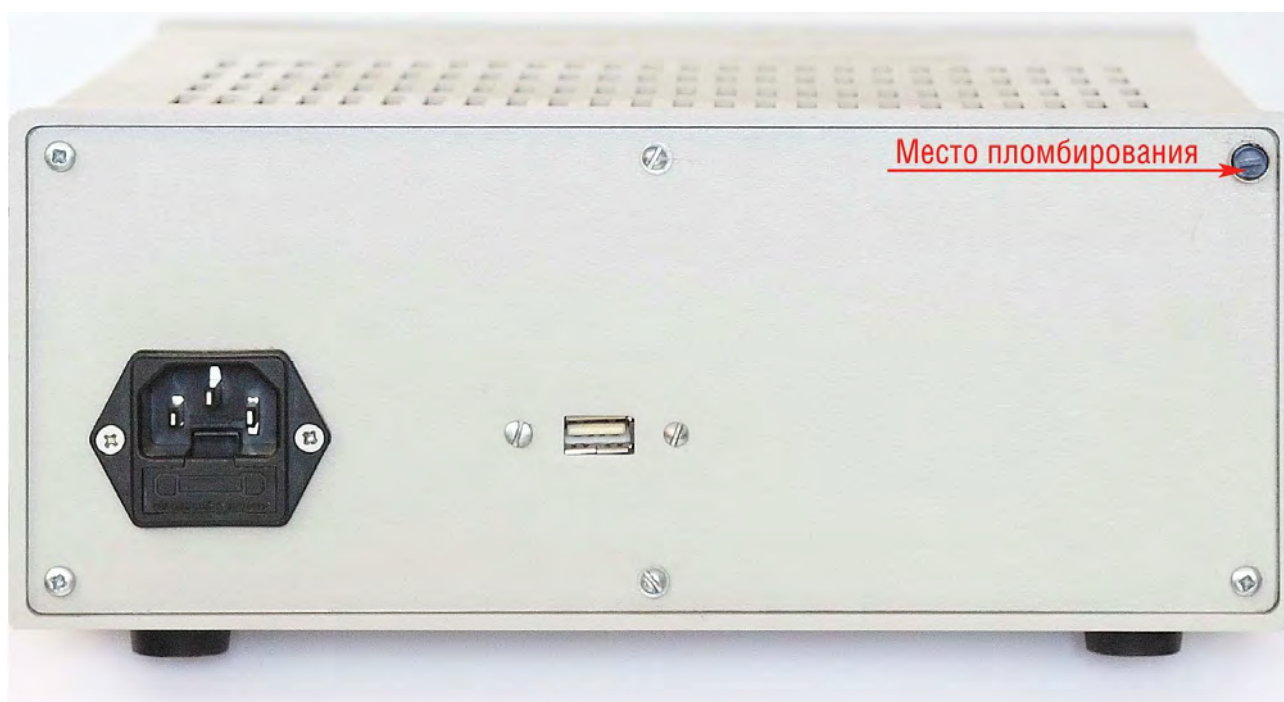
Рисунок 3 – Место пломбировки аттенюатора от несанкционированного доступа