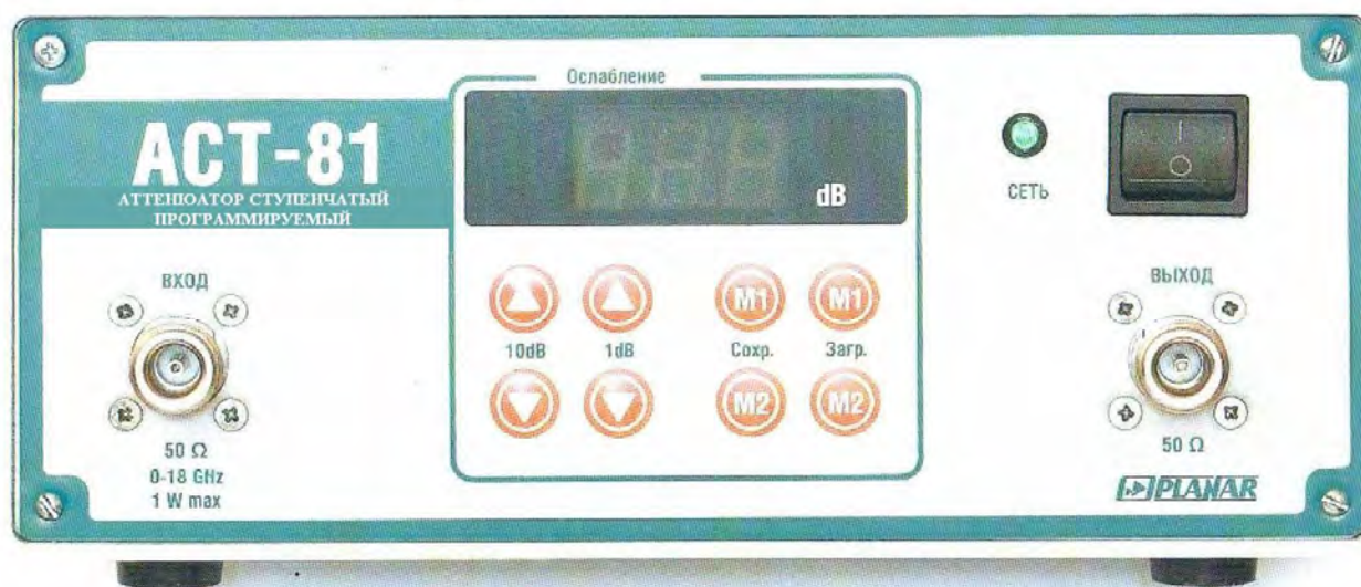
Рисунок 2 - Внешний вид аттенюатора