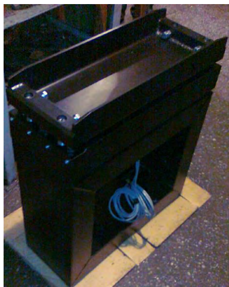
Рис. 1 Общий вид весовой рамы

Весы состоят из грузоприемного устройства (ГПУ) и вторичного преобразователя. ГПУ представляет собой одну весовую раму (модуль), установленную под секцией рольганга и опирающуюся на четыре тензорезисторных датчика HLC (пр-во ф. "Hottinger Baldwin Messtechnik GmbH", Германия, Госреестр № 21177-07). В качестве вторичного преобразователя применяется прибор весоизмерительный WE 2110 (пр-во ф. "Hottinger Baldwin Messtechnik GmbH", Германия, Госреестр № 20785-07).