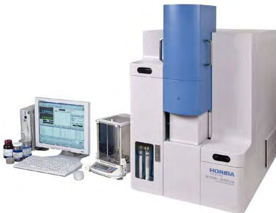
Рисунок 1 – Общий вид анализатора