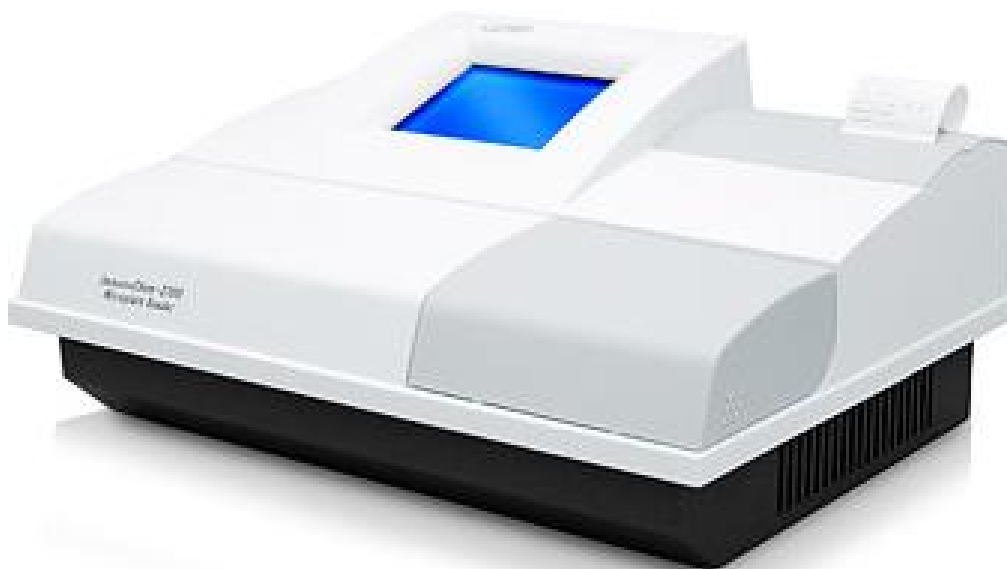
Рисунок 1 – Общий вид фотометра

Конструктивно фотометры выполнены в виде двух блоков - блока считывания и блока обработки результатов измерений, размещенных в едином корпусе. Блок считывания представляет собой механизм, обеспечивающий горизонтальное перемещение планшета. Блок обработки результатов измерений представляет собой микрокомпьютер, предназначенный для управления анализатором и обработки результатов измерений с применением встроенного программного обеспечения посредством сенсорного экрана.