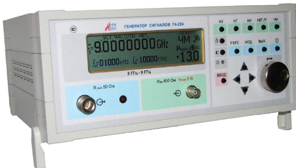
Рисунок 1. Общий вид генератора