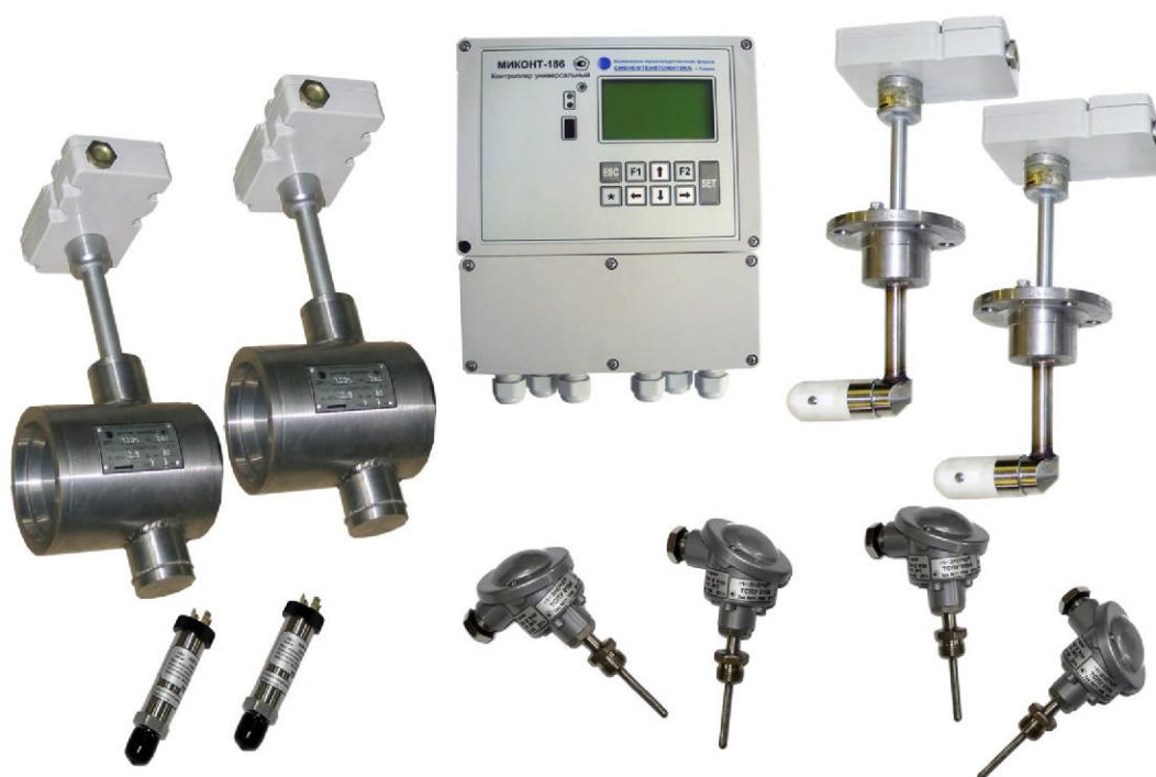
Рисунок 2 – Счетчик тепловой энергии СТС.М-80В-200.