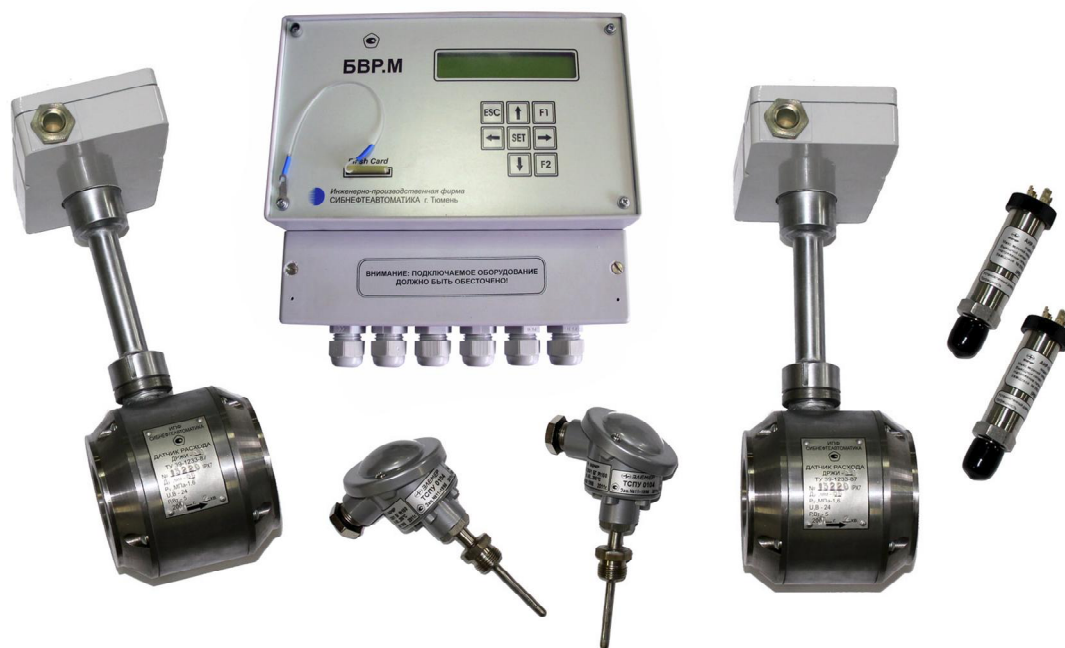
Рисунок 1 – Счетчик тепловой энергии СТС.М-50.