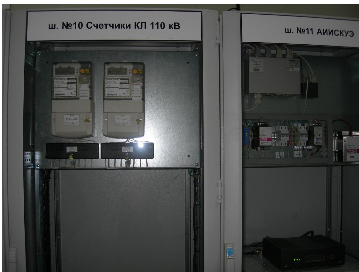
Общий вид основных составных частей АИИС КУЭ ПС 110 кВ «Роза – Хутор»