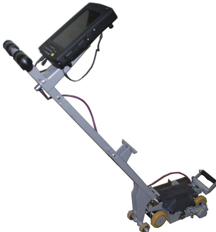
Рисунок 1 – Вид прибора ИНТРОКОР

Фотография прибора представлена на рисунке 1.