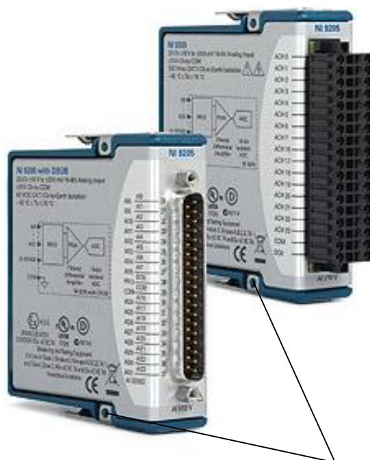
Рисунок 1. Общий вид измерительного блока

модули преобразователей напряжения NI 9205