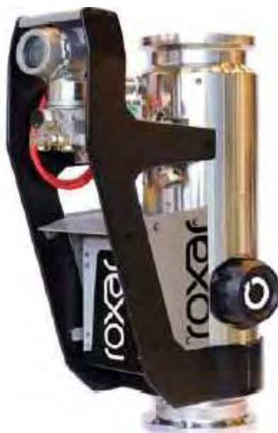
Фото 1 – Фотография общего вида многофазного расходомера Roxar MPFM 2600

Для получения результатов измерений текущего расхода и количества нефти, воды и газа в объёмных и массовых единицах используется ПО «Flow Computer Software Version 4.06», установленное в энергонезависимую память компьютера потока.