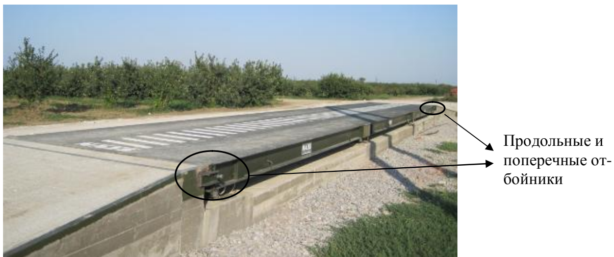
Рисунок 1 - Фотография весов автомобильных тензометрических ВАТ