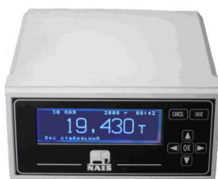
Рисунок 2 - Фотография индикатора/терминала

ГПУ служит для принятия нагрузки. Грузоприемная платформа устанавливается на весоизмерительные датчики, которые базируются на недеформируемом основании.