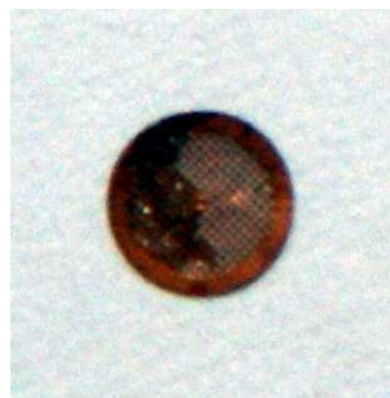
Рисунок 1 - Фото меры длины рельефной МПУ278нм для просвечивающей электронной микроскопии в футляре (1а), отдельно (1б)

Подложка (медная сетка) имеет форму круга диаметра 3 мм и толщиной 0,3 мм. Реплика выполнена из углерода, выступы отненены платиной методом напыления, диаметр рабочей области – 1 мм. Кадр рабочей поверхности меры наблюдаемый в атомно-силовой микроскоп, приведен на рис. 2.