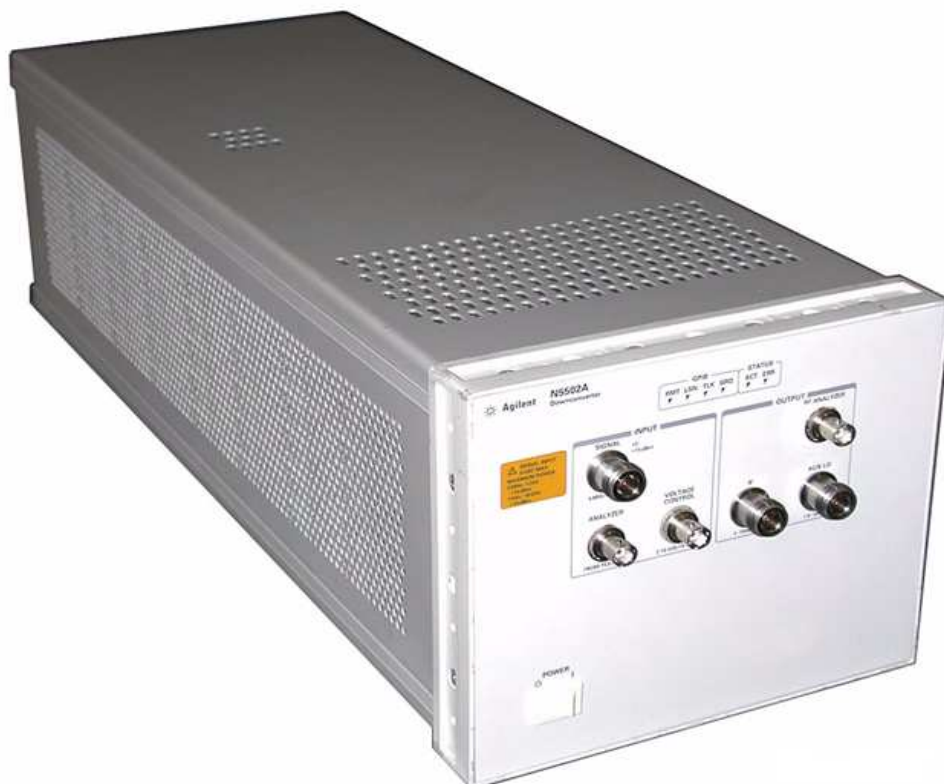
Рисунок 3 – Преобразователь частоты