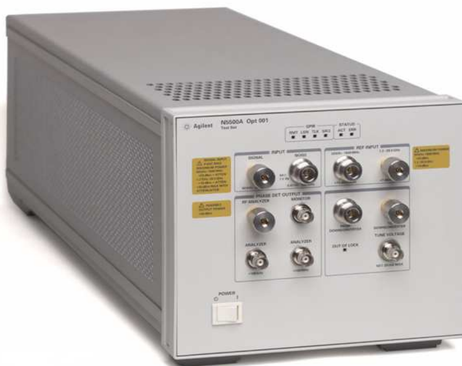
Рисунок 2 – Измерительный блок