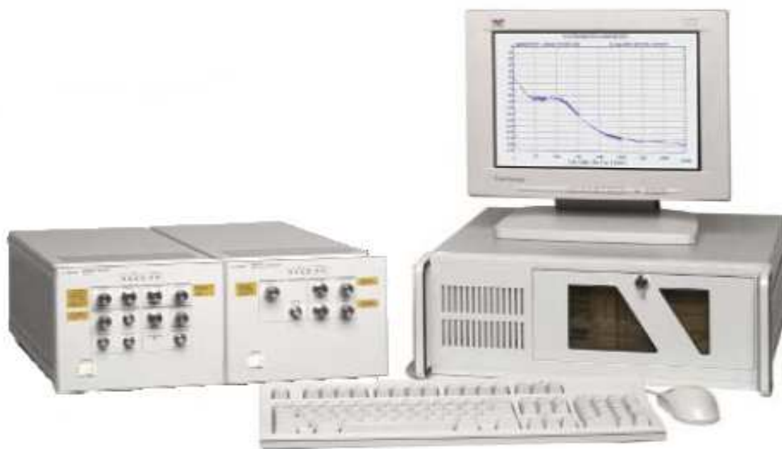
Рисунок 1 – Общий вид системы