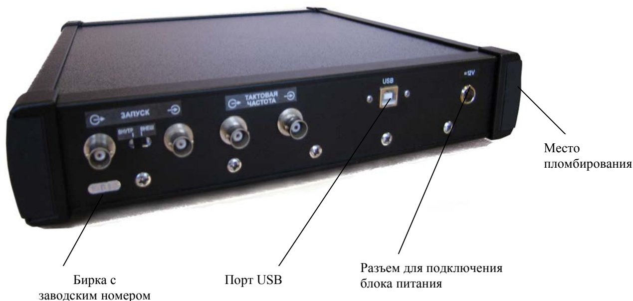
Рисунок - 2 Схема пломбирования и маркировки задней панели генератора

Задняя панель генератора с указанием расположения основных разъемов и заводского номера прибора представлена на рисунке 2.