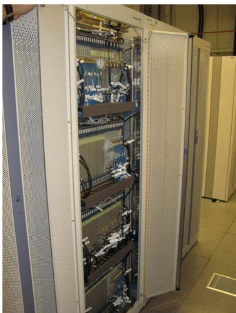
Рисунок 1 - Общий вид оборудования с открытой дверью

Общий вид оборудования и схема пломбировки от несанкционированного доступа, представлены на рисунках 1 и 2.