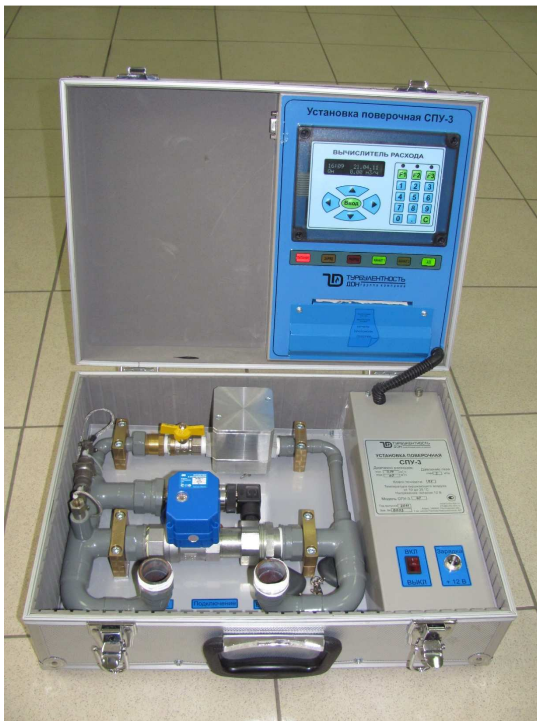
Рисунок 1- Общий вид установки поверочной СПУ-3

На рисунках 2 и 3 приведены схемы пломбировки и обозначение мест для нанесения пломб и наклеек в целях предотвращения несанкционированной настройки и вмешательства.