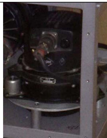
Рисунок 2 - Измеритель углов поворота (гироскопический датчик курса)