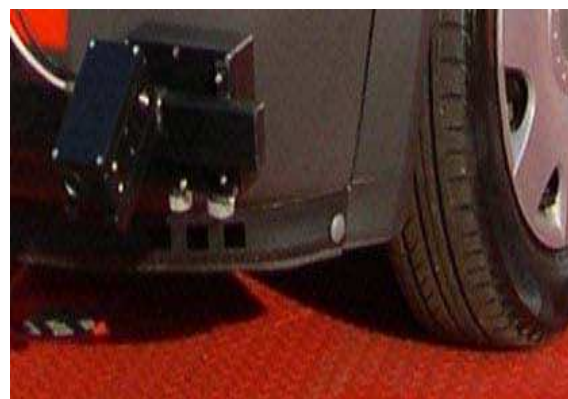
Рисунок 8 - Измеритель ординат неровностей покрытия (профилومتر)