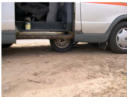
Рисунок 7 - Измеритель коэффициента сцепления покрытия