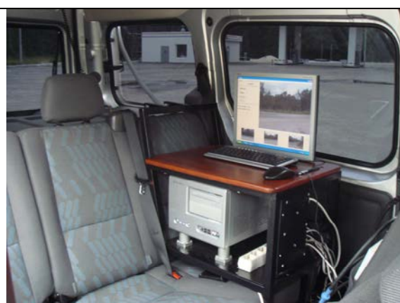
Рисунок 10 - Рабочее место оператора АДК-М