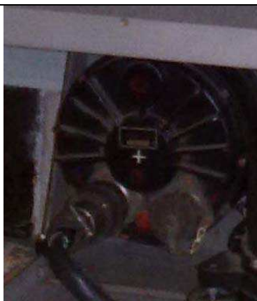
Рисунок 3 - Измеритель уклонов (гироскопический датчик вертикали)