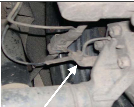
Рисунок 1 - Измеритель протяженности пути (датчик пути)

Программное обеспечение АДК-М разработано с учетом требований безопасности и исключения несанкционированного, как случайного или непреднамеренного доступа, так и от преднамеренных изменений. С этой целью осуществлена прошивка управляющей программы АДК-М непосредственно в микросхемы нижнего уровня интерфейсного блока, что соответствует уровню «А» защиты программного обеспечения от непреднамеренных и преднамеренных изменений в соответствии с МИ 3286-2010.