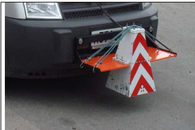
Рисунок 5 - Измеритель толщины покрытия (георадар)