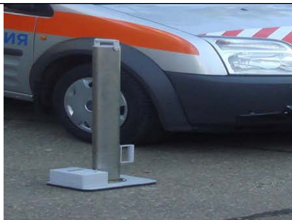
Рисунок 6 - Измеритель упругого прогиба покрытия (прогибомер)