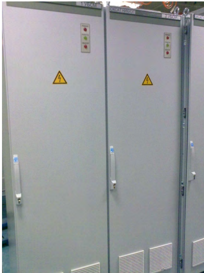
Рисунок 1 – Внешний вид приборной стойки

комплектования определяется Заказчиком и указывается в заказе-заявке на поставку.