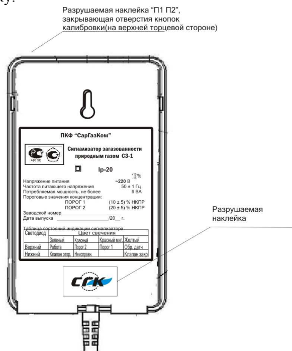
Фото 2 - Схема пломбировки сигнализатора от несанкционированного доступа и обозначение мест для нанесения наклеек с клеймом поверителя