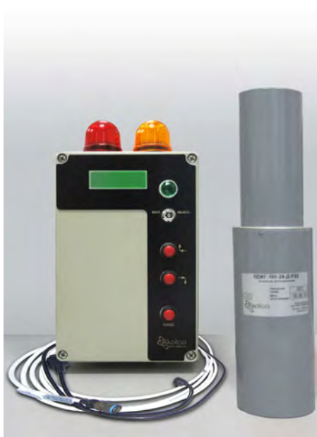
Рисунок 1 – Устройство детектирования УДЖГ-101.

Внешний вид установки представлен на рисунке 1.