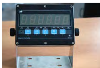
Рисунок 3 – Вид индикатора Микросим-06