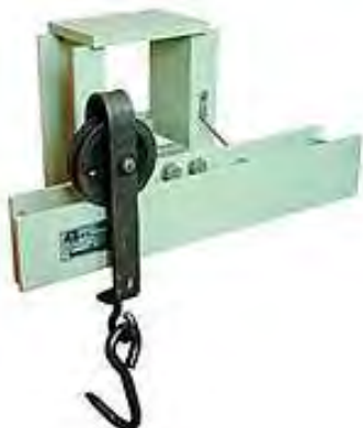
Рисунок 1 – Вид модификации М8700-1