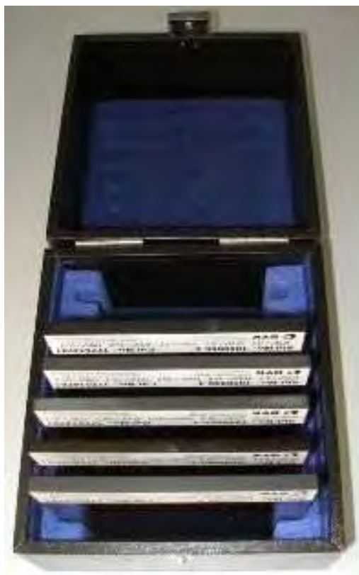
Рисунок 2 - Схема размещения светофильтров в футляре

Общий вид светофильтров с указанием марки изготовителя, заводского номера и основных характеристик представлен на рисунке 3.