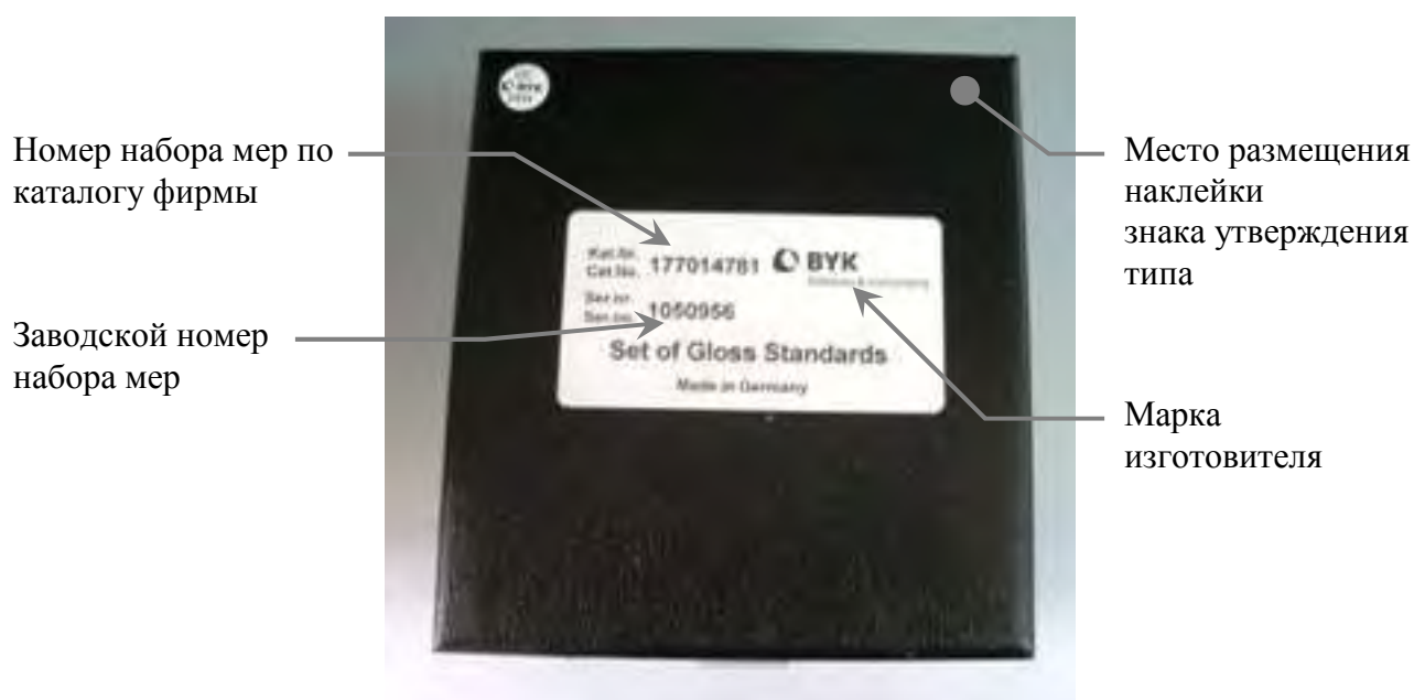
Рисунок 1 - Схема маркировки футляра для светофильтров

Общий вид футляра для светофильтров с указанием марки изготовителя, заводского номера, наименования набора мер, места размещения наклейки знака утверждения типа представлен на рисунке 1.