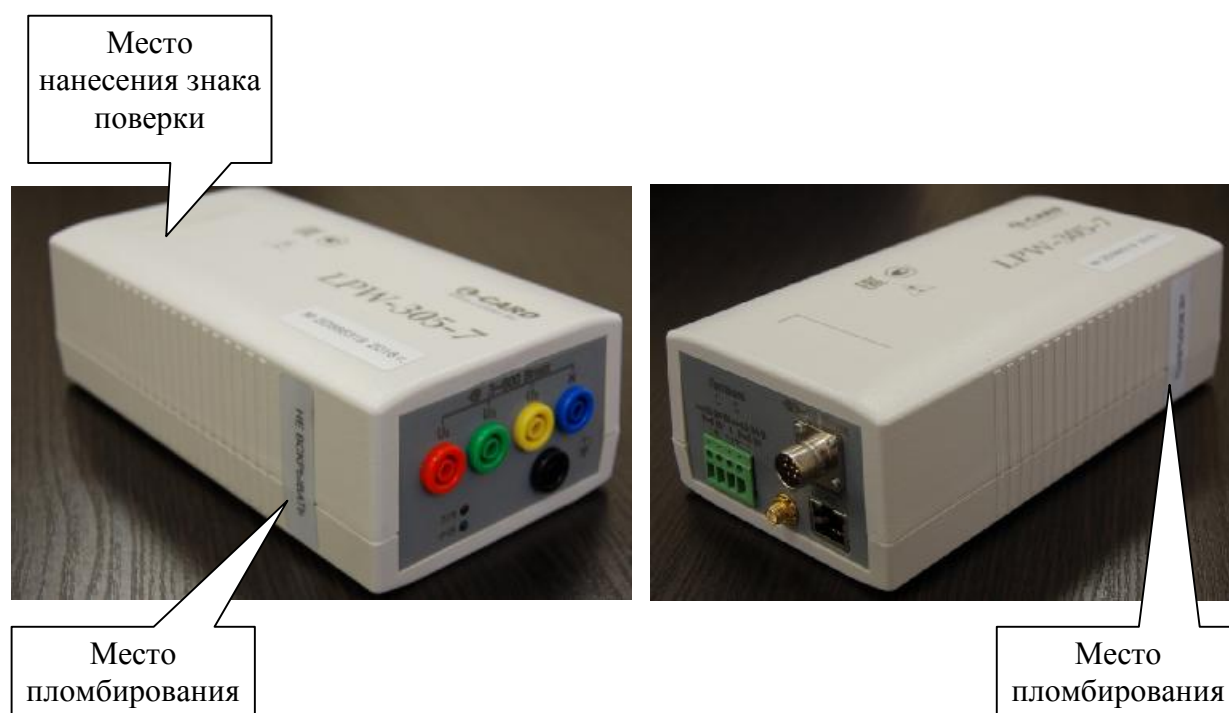
Рисунок 3 - Внешний вид измерителей портативного типа, места их пломбирования и нанесения знака поверки