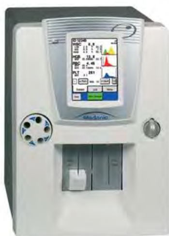
Рисунок 2 – Общий вид анализатора исполнение M16M GP, M20M GP