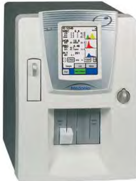
Рисунок 3 – Общий вид анализатора исполнение M16C Closed Tube , M16C Closed Tube ABR , M20C Closed Tube, M20C Closed Tube ABR