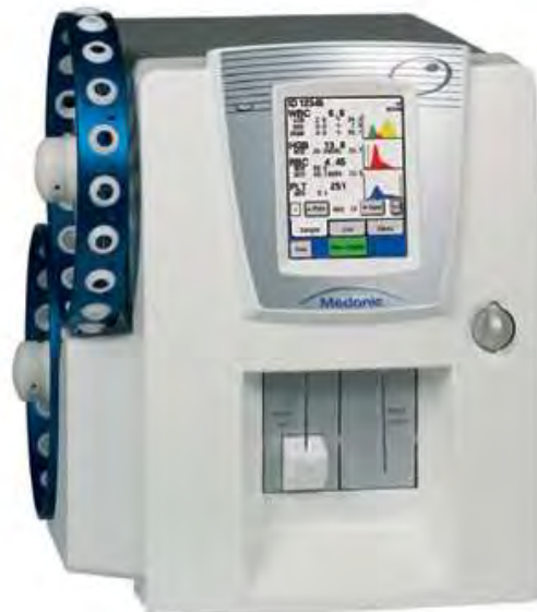
Рисунок 4 – Общий вид анализатора исполнение M16S Autoloader, M16S Autoloader ABR, модель M20S Autoloader, M20S Autoloader ABR