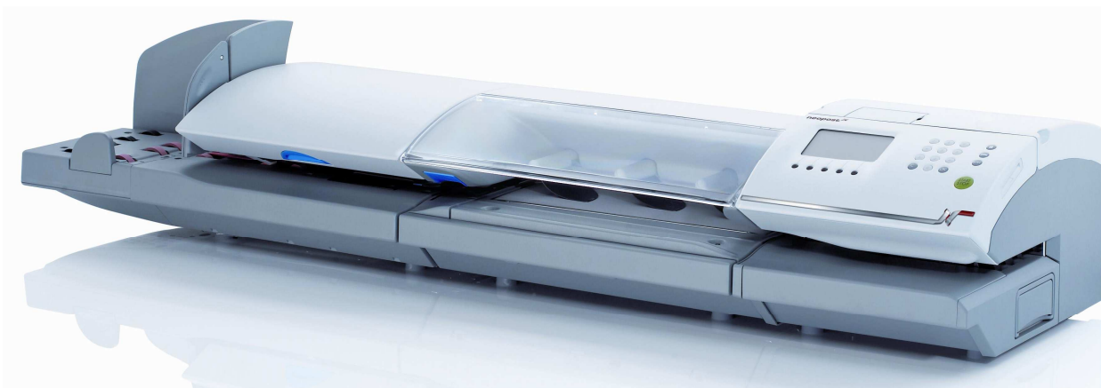
Рисунок 1 - Устройства весоизмерительные автоматические «Neopost Granit», модификация «DYNAMIC SCALE - DS-HR»

Устройство выпускается в одной модификации и имеет обозначение: «DYNAMIC SCALE - DS-HR» (рис. 1).