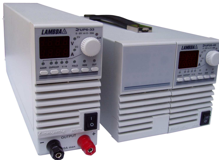
Рисунок 1 – Фотография общего вида

Уровень защиты ПО от непреднамеренных и преднамеренных изменений в соответствии с МИ 3286-2010 — «А».