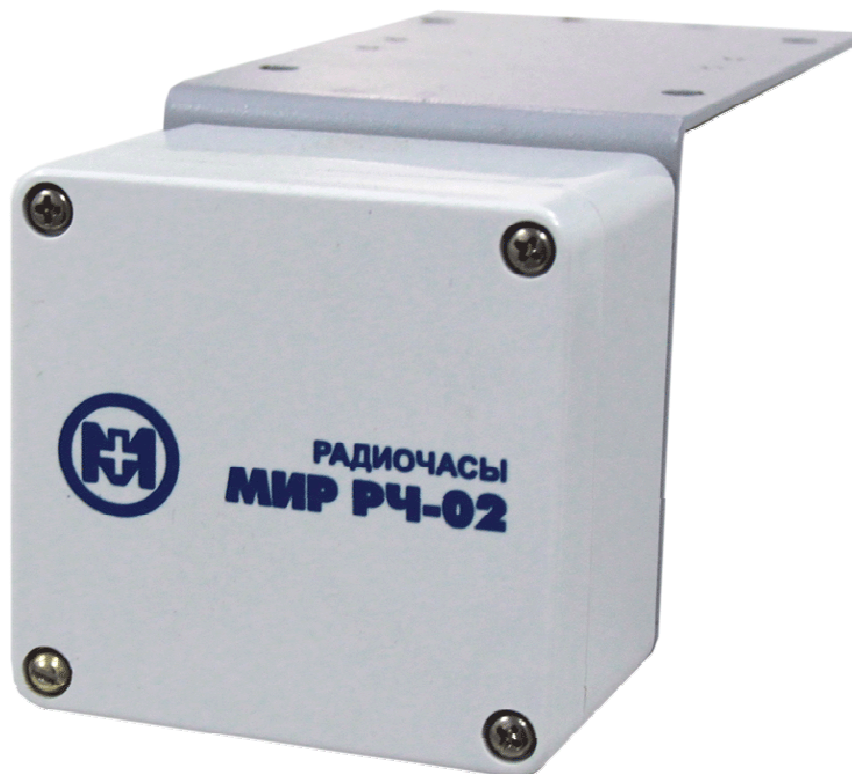
Рисунок 1 – Общий вид радиочасов

Конструкция радиочасов обеспечивает ограничение доступа к определенным частям в целях предотвращения несанкционированной настройки и вмешательства путем пломбирования. Пломбирование, маркирование/ клеймение радиочасов осуществляется в пломбировочную чашку на одном из винтов экрана платы, установленном в корпусе радиочасов (см. рис. 2).