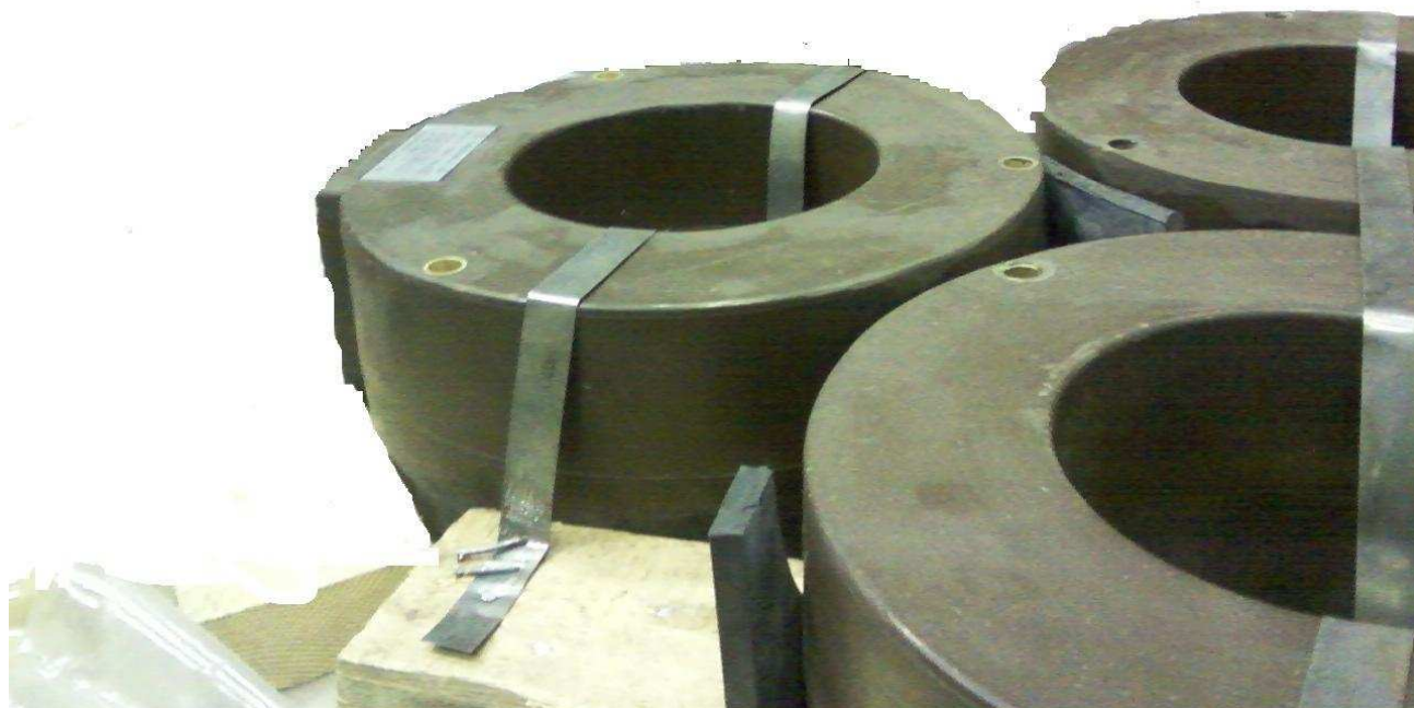
Общий вид трансформатора ТВЛ-10

Трансформаторы тока устанавливаются на плите турбогенератора в коробке нулевых выводов.