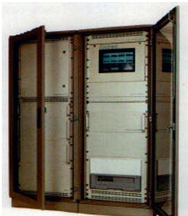
Рисунок 1 – Внешний вид модуля анализа EMIRAK 3