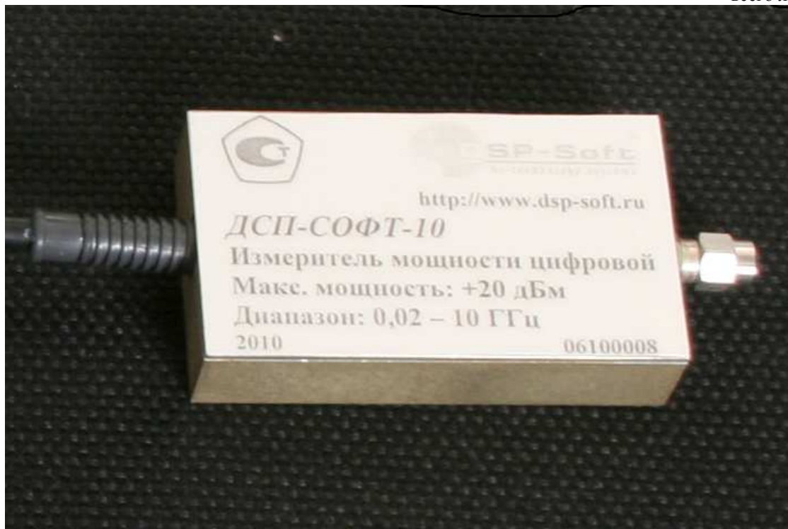
Рисунок 1 – Внешний вид измерителя мощности цифрового ДСП-СОФТ

Схема пломбировки от несанкционированного доступа и обозначение мест для нанесения наклеек показана на рисунке 2.