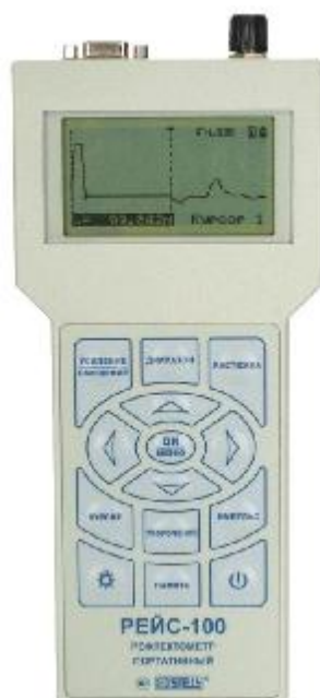
Рисунок 1 - Внешний вид РЕЙС-100

Внешний вид РЕЙС-100 с указанием места нанесения знака утверждения типа и защиты от несанкционированного доступа в виде пломбировки корпуса приведен на рисунке 2.